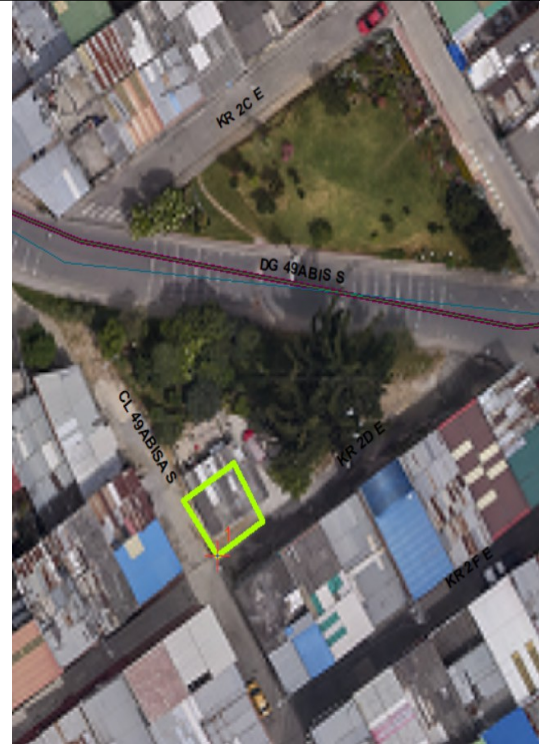
Localización en la BDGC – SDP

El predio con nomenclatura KR 2D Este 49A 35 Sur y CHIP AAA0253FWJZ corresponde al Lote urbanístico No. 1 de la Manzana 77A según el plano US225/4-4 y el cuadro de Áreas contenido en el plano US225/4-5 pertenecientes al desarrollo Diana Turbay legalizado mediante la Resolución No. 1772 del 13/12/1993.